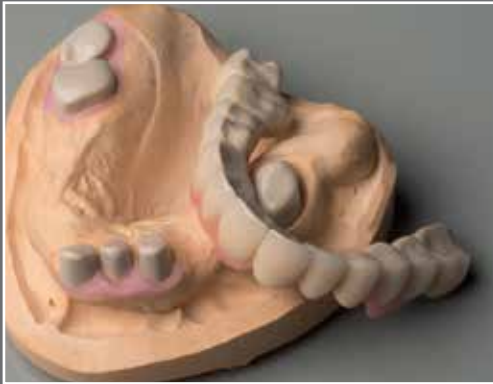
PEEK Primär- und Sekundärkonstruktion