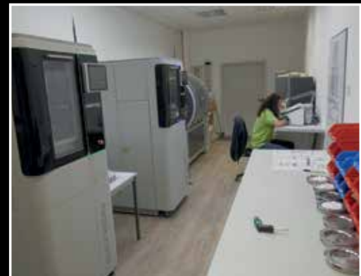
Für die Fräsprozesse werden moderne 4- und 5-achs Fräsautomaten eingesetzt.