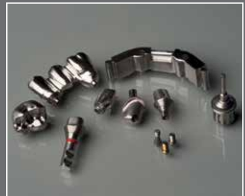
NEM/Titan-Abutments mit Anschlussgeometrie