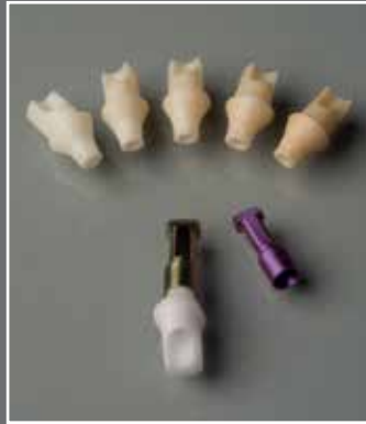
Direktverschraubte Zirkon- Abutments in sechs Farbstufen