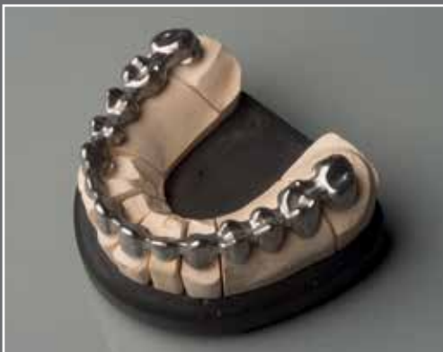
NEM/Titan-Brücke bis 16 Glieder