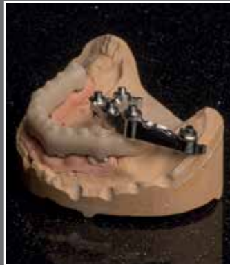
Direktverschraubte Stegarbeit mit einem Tertiärgerüst aus PEEK