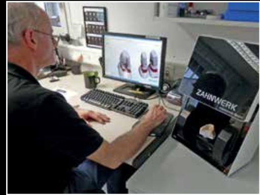
Konstruktionssoftware von 3Shape...