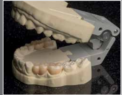
Gefrästes Modell mit 3Shape Mini-Artikulator