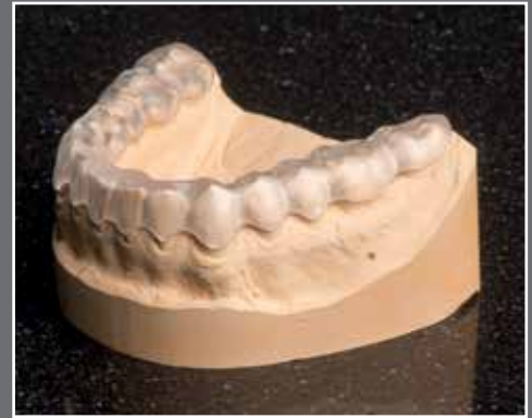
CAD/CAM gefräste adjustierte Schiene